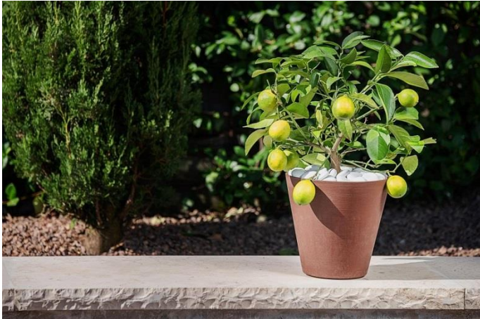
BU: Plant your Vision – Gefäße aus recyceltem Plastik von TeraPlast