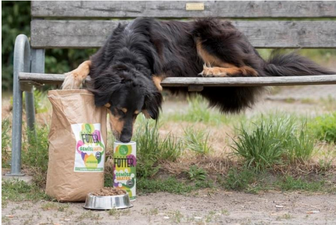
BU: TeneTrio stellt Hundefutter aus Insektenprotein vor