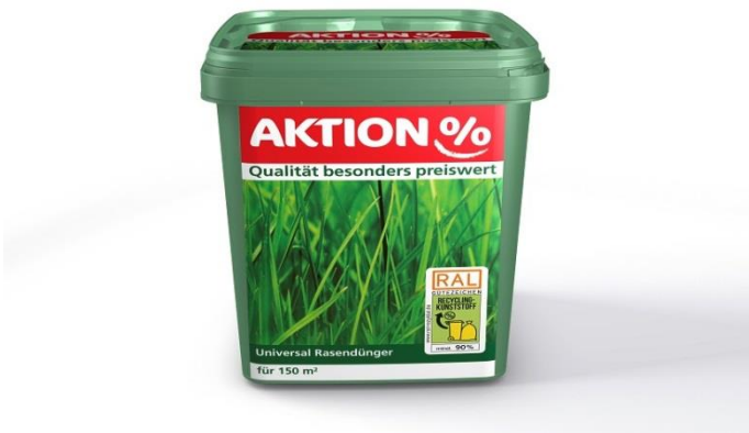
BU: SAGAFLOER-Eimer aus 90 % recyceltem Plastik aus dem gelben Sack